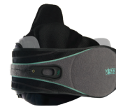
Vista 631 薇斯塔 631