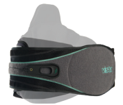
Vista 627 薇斯塔 627