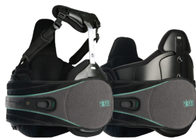
Vista 464 | Vista 639 薇斯塔 464 | 薇斯塔 639

薇斯塔下脊柱系列产品经过独特设计，可自由拆卸，满足每位患者康复过程不同阶段所需的支撑力和运动限制力。