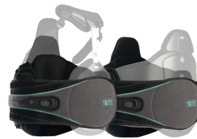
Vista 637 薇斯塔 637